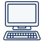
Bild- und Tonqualität können Sie erheblich beeinflussen: