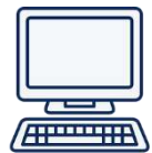
Bild- und Tonqualität können Sie erheblich beeinflussen: